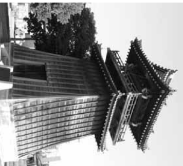
宮の渡し公園（常夜燈）

また、白鳥公園や神宮東公園などの公園は、春の桜、秋の紅葉など、季節によって様々な景色を楽しむことができます。ぜひ、ご参加ください。